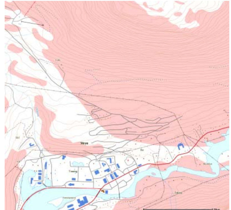
Oversiktskart 1:50 000 for snø og steinskred i Stryn sentrum