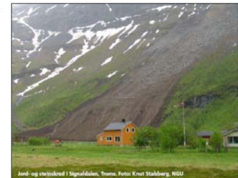
Jord- og steinskred i Signalvålen, Troms.

NVE skal vidareføre det statlege programmet for skredkartlegging, som i hovudsak er ei oversiktskartlegging. Norge geologiske undersøking (NGU) vil ha ei sentral rolle i gjennomføring av kartleggingsarbeidet og NVE vil i samarbeid med NGU utarbeide ein nasjonal kartleggingsplan.