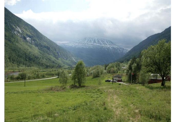
Vestfjorddalen mot Gaustatoppen, Tinn kommune, Telemark, 1880-90 og 2004